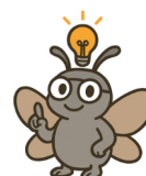
totálně geniální mol